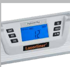
Pantalla con iluminación