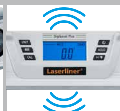
AutoSound a 0°/45°/ 90°/135°/180°