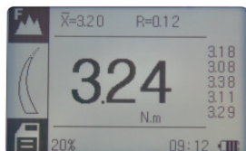
Modo de datos