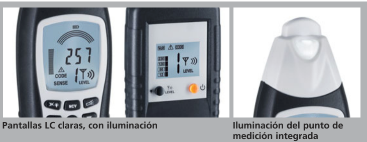
Pantallas LC claras, con iluminación