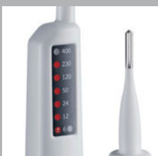
LEDs de indicación de alto contraste